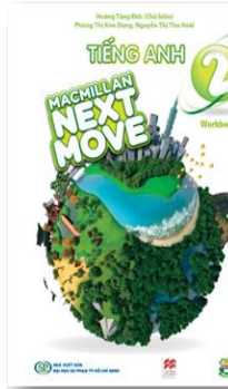
Sách bài tập (Workbook)