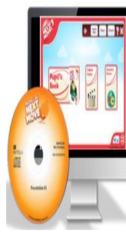
Bộ CD file nghe