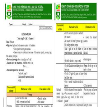
Giáo án tham khảo