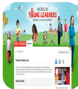
Ngân hàng tài nguyên của giáo viên