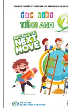
Tập viết TA 2-MMLNM