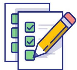
Bài kiểm tra