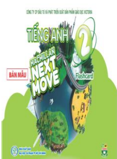
Bộ Flashcard (Khổ A4, A5, A7)