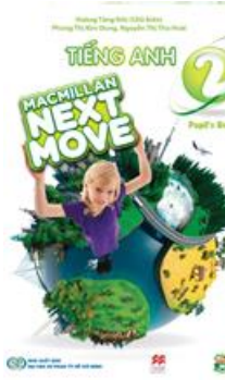
Sách học sinh (Pupil's book)