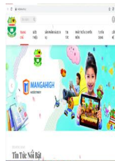
Website trực tuyến