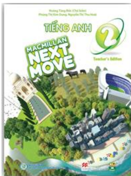
Sách giáo viên (Teacher's Edition)