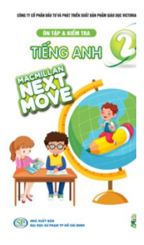
Ôn tập và kiểm tra Tiếng Anh 2- MML Next Move.